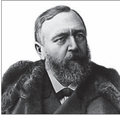
Richard von Krafft-Ebing (1840-1902)

« Psychopathia Sexualis » de Von Krafft-Ebing. Edición de 1886.